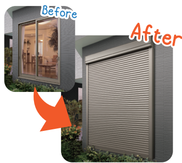
防災・防犯に最適！2階の窓にも