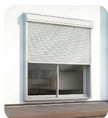
最新のシャッターへ交換。 電動化で快適&安心