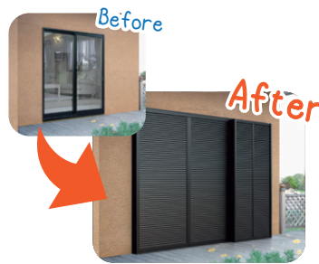
木製一筋の交換にも！